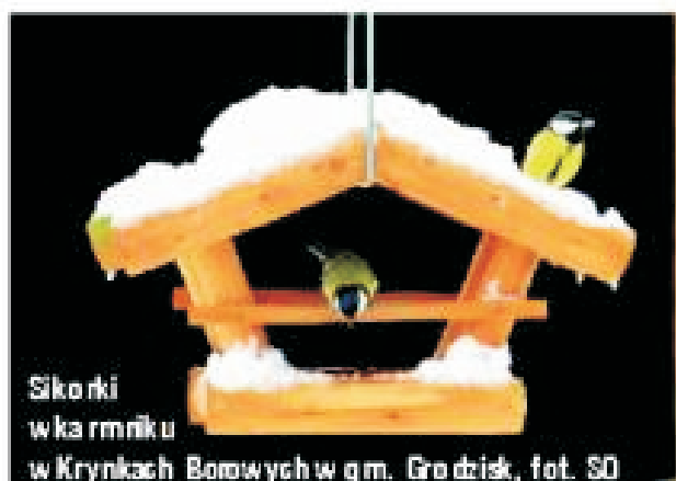
Sikońki w karmniku

w Krynkach Borowych w gm. Grodzisk